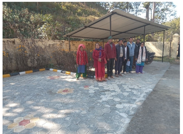
वडा कार्यालय बगैचा तथा ट्रेस निर्माण योजनाको अनुगमन तथा सामाजिक परिक्षण