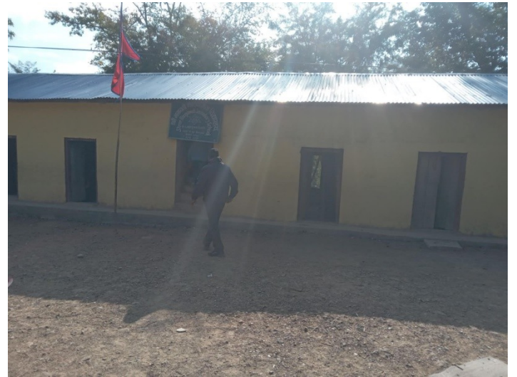
भगवती मा.बि. भवन छाना मर्मत योजनामा सामाजिक परिक्षण गरेको निर्माण गरेको संरचनाको दृश्य