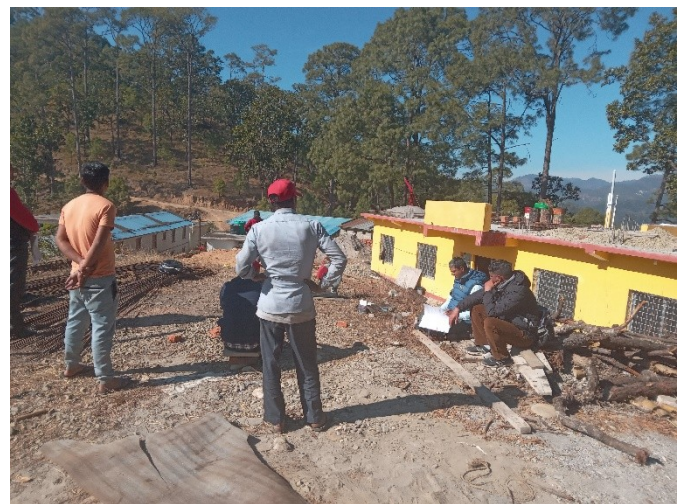
भानु मा.बि. चित्रपुरमा निर्माण भएको भवनको स्थलगत अनुगमनका साथै सामाजिक परिक्षण