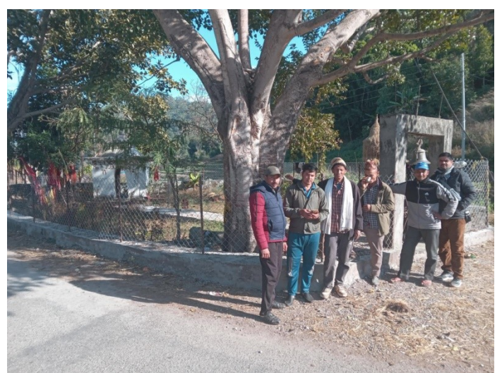
समैजी मन्दिर निर्माण योजनामा सामाजिक परिक्षण कार्यक्रम चुरे -१, चटकपुर